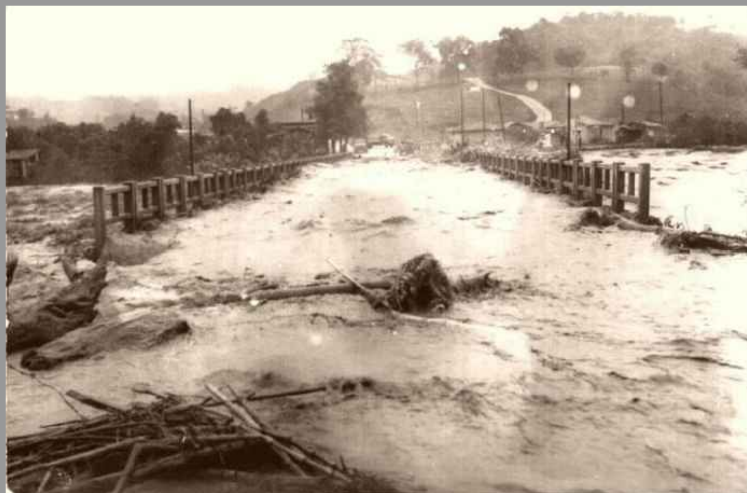
Fig 005 Pontes destruídas.

ENCHENTE DE 74 (maio de 1974): Fato marcante e transformador do município de Orleans, quanto a implantação e a atividade ferroviária.