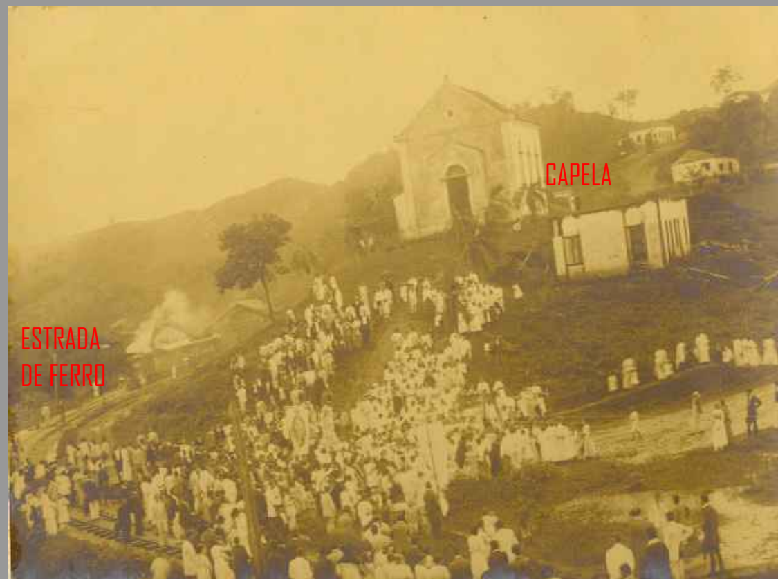
Fig 002 Data Comemorativa em frente a Capela, próxima da Estrada de Ferro e do rio Tubarão.

O município de Orleans foi fundado em 26 de Dezembro de 1884.