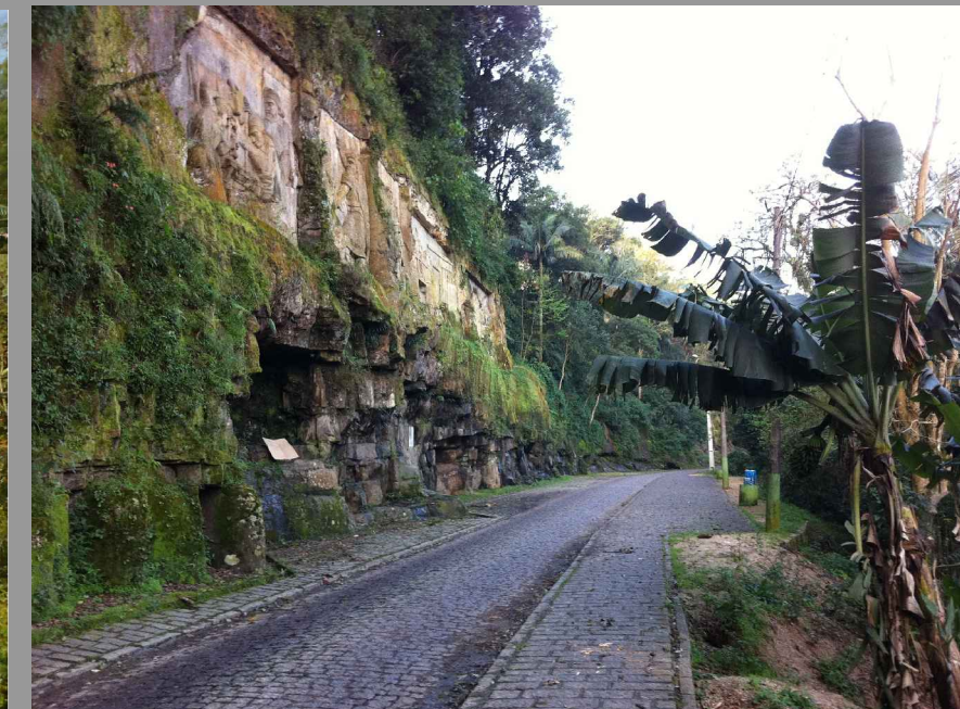
Fig 008 Esculturas do Paredão: escultor orleanense José Fernandes.