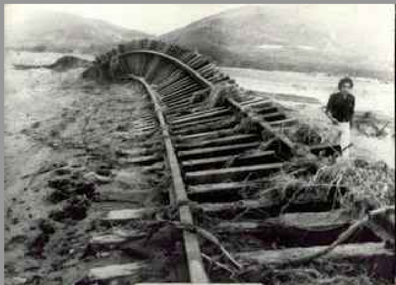
Fig 006 Estrada de Ferro retorcida com a força das águas do rio Tubarão.

Populaçã.o temerosa pela força do rio Tubarão, afasta-se das proximidades do rio. O entorno do rio Tubarão passa a ser rejeitado e desapropriado pela população. Fortalecimento da formação das grandes avenidas em direção as áreas mais elevadas do território central Fim da linha férrea no município.