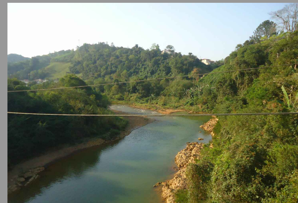
Fig 007 Vista da paisagem natural. Fonte Imagem: acervo pessoal autora

Portanto, uma significativa área do município de Orleans a ser valorizada e qualificada.