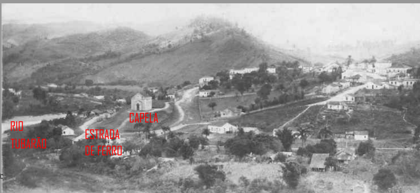
Fig 003 Primeiras edificações do município.

Período com abertura de ruas, venda dos primeiros lotes e construção da Capela nas imediações da Estrada de Ferro.