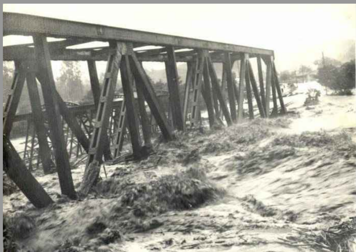
Fig 004 Enchente de 1974 - rio Tubarão destruindo a Estrada de Ferro (o trecho da ferrovia que passava por Orleans não foi reconstruída)